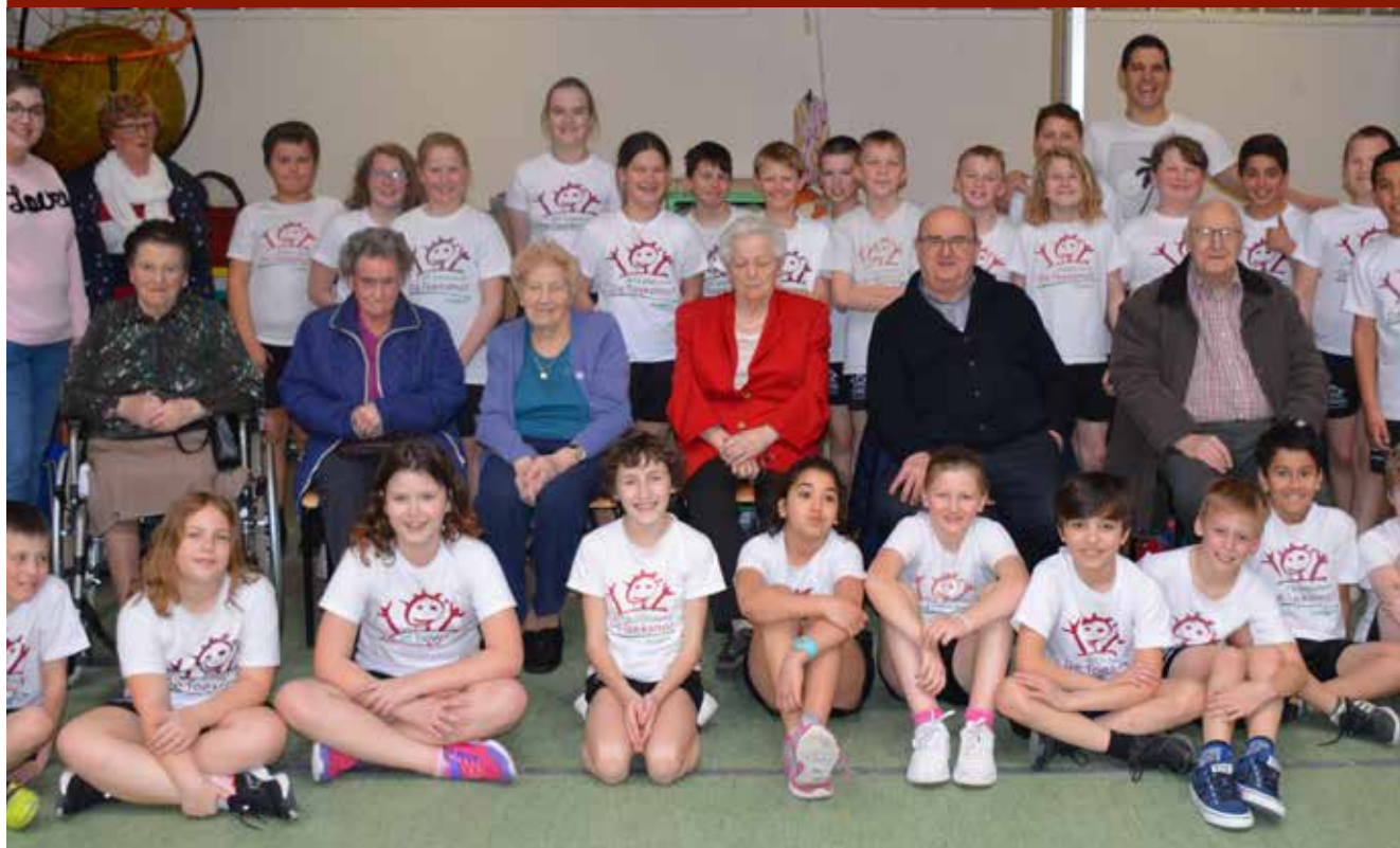
De bewoners van woon-zorghuis Ter Meersch en van WZC Sint-Vincentius terug op de schoolbanken